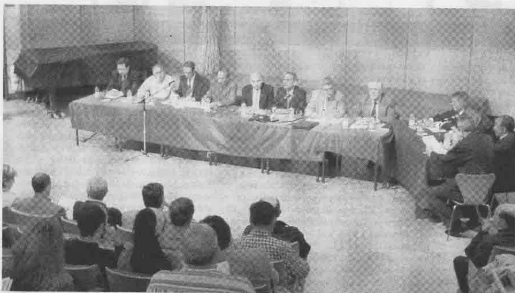
La mesa redonda sobre pesca y ríos de León atrajo a un centenar de aficionados.